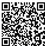
国才考试官方网站