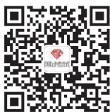
国才考试官方微信